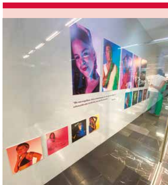
Figura 2. Vitrina de la exposición. Figure 2. Exhibition showcase.