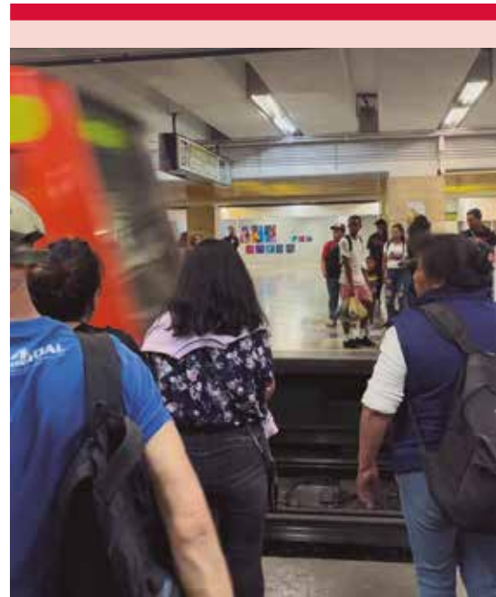
Figura 1. Vista de la exposición saliendo de los vagones del metro.

In the world of art, we have seen how visual representations have transformed the perception of beauty throughout history. A notable example comes from the muralist movement in the 20th century; artists such as Diego Rivera, Jose Clemente Orozco, David Alfaro Siqueiros, and Frida Kahlo used their works to represent people, like you and me, on a monumental scale. In doing so, they challenged traditional beauty norms and highlighted the dignity of diversity.