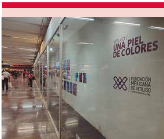
Figura 3. Muestra de la exposición fotográfica “Vitiligo: una piel de colores”.